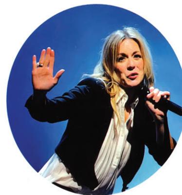
Véronic DiCaire, chanteuse et imitatrice canadienne.