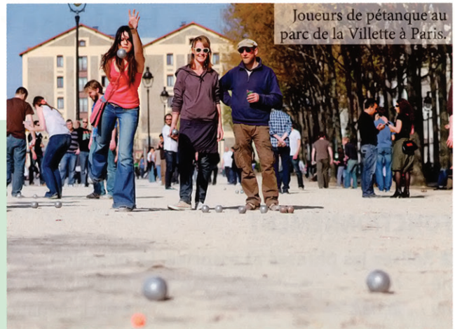
Joueurs de pétanque au parc de la Villette à Paris.

« En France, la pétanque et le jeu provençal 1 sont des sports majeurs avec plus de 350 000 licenciés dont 20 000 femmes et 15 000 jeunes, se réjouit Hervé Rofritsch. C'est la 4 e fédération sportive nationale. Ce sport évolue : de plus en plus de gens jouent maintenant aux boules pour des parties conviviales 2 . On note aussi une augmentation des terrains de boules à domicile ! Une autre tendance : la pétanque se développe énormément à l'étranger. Les pays proches de la France sont bien sûr présents mais aussi la Suède, la Norvège, le Danemark et, hors Europe,